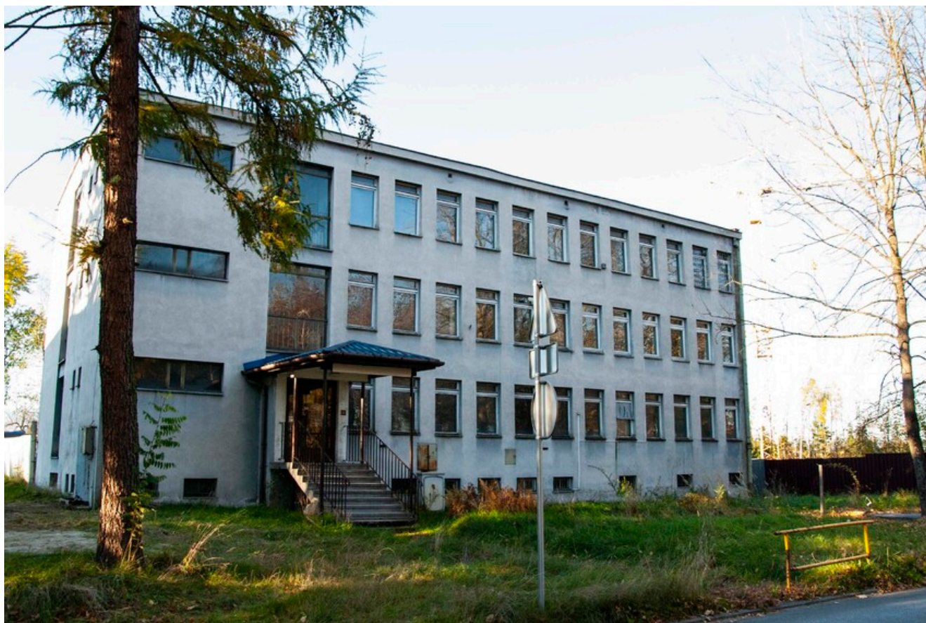
SZEW, stan obecny: 2021 r., fot. Agnieszka Masłowska, IPN Kraków.